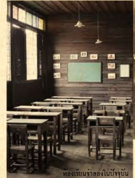
ห้องเรียนจำลองในปัจจุบัน